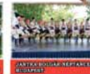
BOLGÁR NEMZETI FOLK ÉNEKES- TÁNCOS TÁRSASÁG