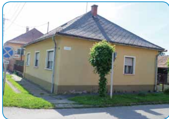
Ram, steroga so v Varaša kúpili, so prejkzozidali

smo kosili, samo tejsto je zdaj že vse zaraštjeno, vse je gauštja.«