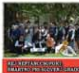
SZLOVÉN NEMZETI FOLK ÉNEKES- TÁNCOS TÁRSASÁG