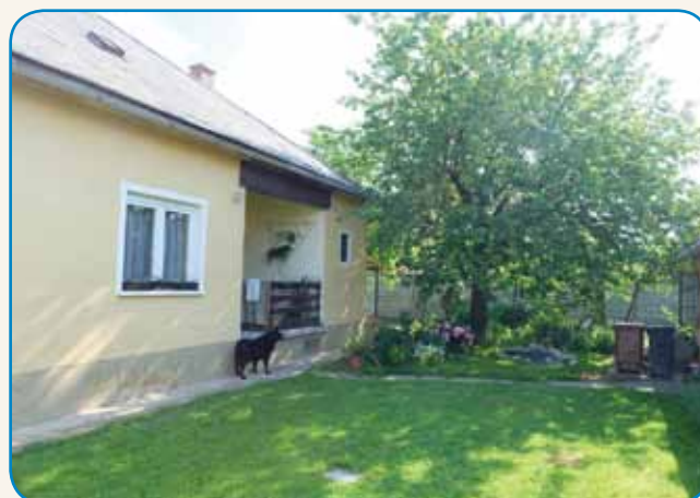
S KRŪJOM SMO DJELI DJABOKE stran 8