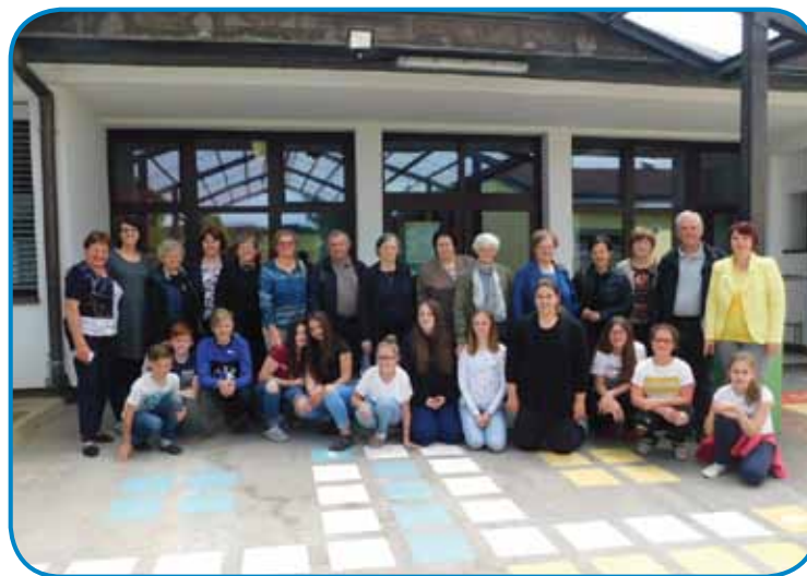
Porabski penzionisti, lerance pa mali mentorji pred šaulov v Kuzmi