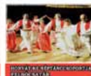
HORVÁTI NEMZETI FOLK ÉNEKES- TÁNCOS TÁRSASÁG