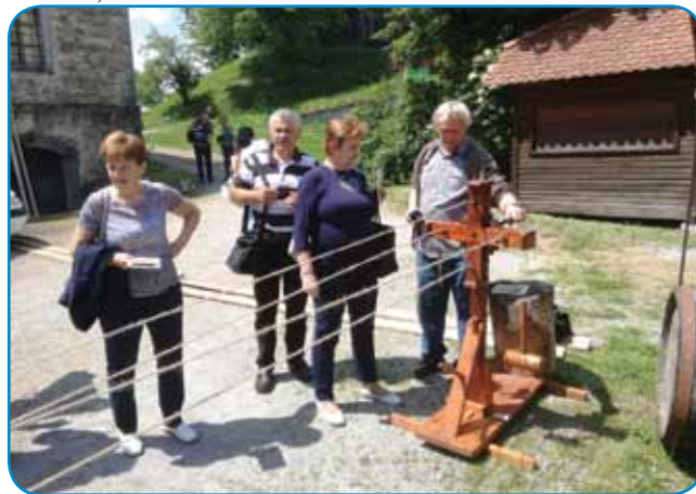
Ogledali smo si, kako se izdelujejo vrvi

Nato smo si ogledali interaktivno kulturnozgodovinsko razstavo, ki jo je predstavil domačin, oblečen v starinsko oblačilo. Razkazal nam je stare zemljevide, oklepe in orožja. Sledilo je spoznavanje s kovanjem novcev in tiska-