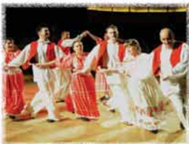
FS HKD GORNJI ČETARCI