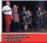
RILA NEMZETI FOLK ÉNEKES- TÁNCOS TÁRSASÁG