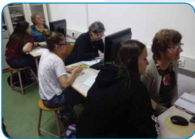
Šaularge so nam dosta pomagali