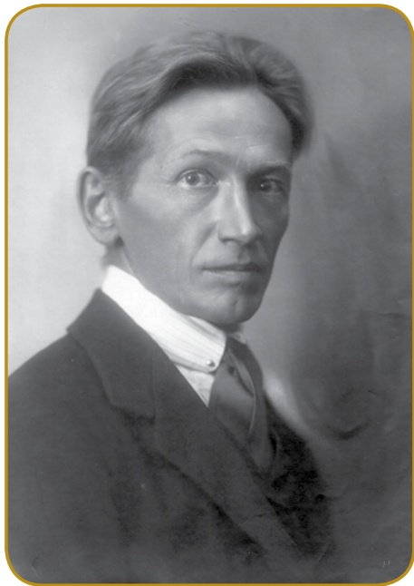
Oton Župančič je biu med prvimi člani slovenske akademije (SAZU)

Zbirka »Čaša opojnosti« je vöprišla leta 1899, v gnakom leti kak Cankarova »Erotika«.