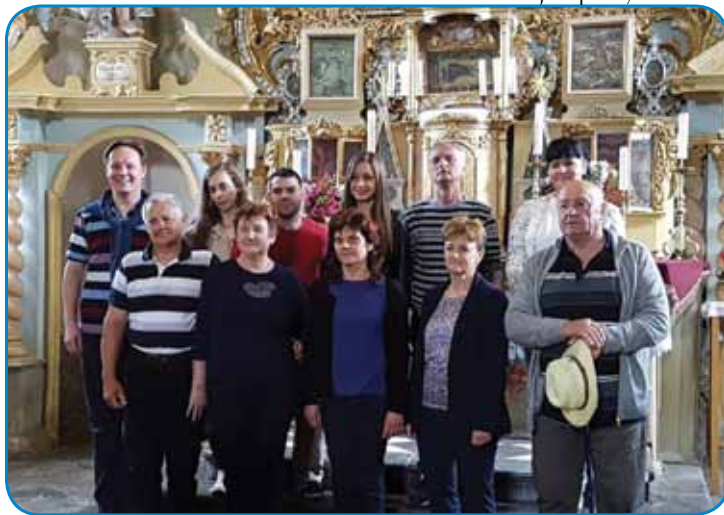
Delegacija iz Slovenske vesi v Porabju v cerkvi sv. Frančiška Ksaverija