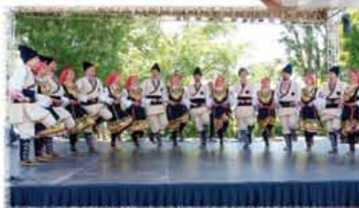
BOLGARSKA FS JANTRA BUDIMPEŠTA