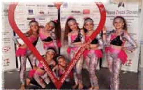
PLESNA ŠOLA ZEKO MURSKA SOBOTA