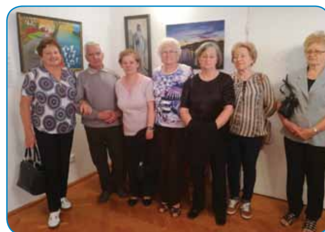
Skupina Porabk in Porabca na razstavi

iz starih arhivov. Tako je nastala monografija, kar je bilo ob toliko vložene delo celo logično,« smo izdeli od likovne pedagoginje.