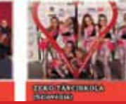
ZEKO NEMZETI FOLK ÉNEKES- TÁNCOS TÁRSASÁG