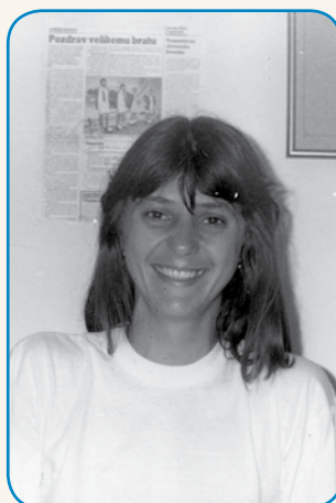
FURT SAM SI ŽELEJLA ... stran 4