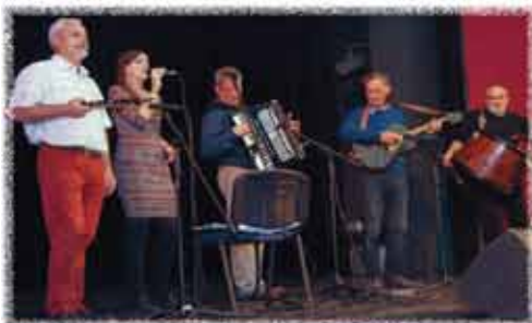
GLASBENA SKUPINA RILA BUDIMPEŠTA