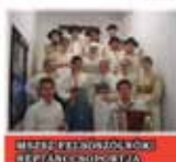
HUNGÁRIAI NEMZETI FOLK ÉNEKES- TÁNCOS TÁRSASÁG