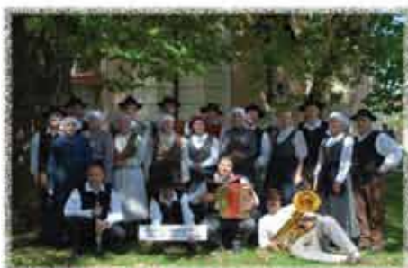
FS REJ ŠMARTNO PRI SLOVENJ GRADCU