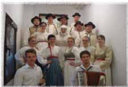
FS ZSM GORNJI SENIK