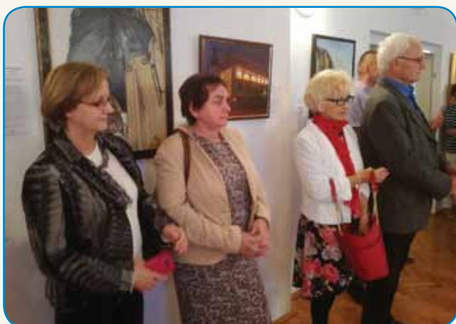
POGLEDI NA MARIBOR - DRUGAČNI OD OBIČAJNIH stran 3